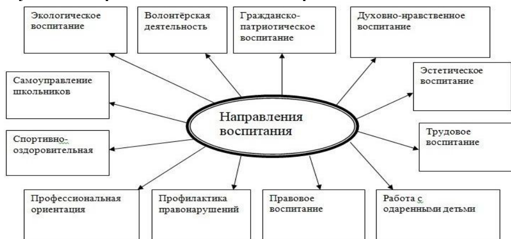
Рисунок 1. Направления воспитательной работы

Цель «Разговоров о важном» - пробуждение интереса к изучению отечественной истории и культуры, воспитание гражданственности и патриотизма, формирование и конкретизация понятия «Родина», осознание собственного отношения к ней; формирование представления о культурном и историческом единстве русского народа и важности его сохранения.