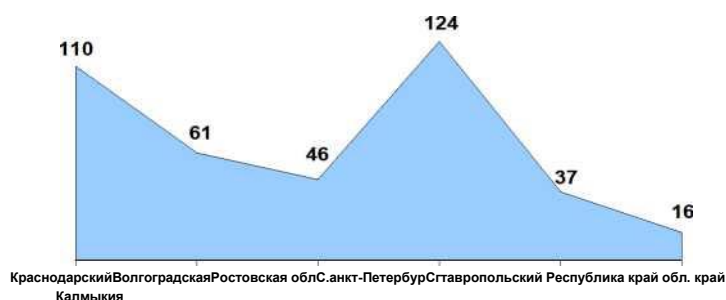
Рисунок 1 - Сведения о количестве учреждений социального обслуживания семьи и детей