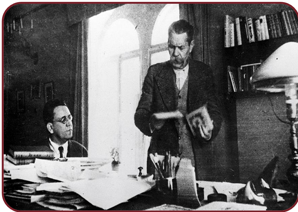
С.Я. МАРШАК В РАБОЧЕМ КАБИНЕТЕ МАКСИМА ГОРЬКОГО

В начале 20 века семья перебралась в Петербург. Здесь одаренный юноша познакомился и подружился со многими выдающимися представителями творческой интеллигенции: Максимом Горьким, Александром Блоком, Фёдором Шаляпиным, Владимиром Стасовым.